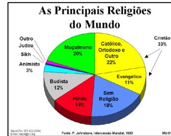
Gráfico – A Tarefa Inacabada – População

A religião dos sikhs surgiu como alternativa para o islamismo e o hinduismo. Existe somente um deus e um livro santo (o Guru Granth). Algumas práticas: não cortar o cabelo nem barba, utilizar um pente para mantê-los penteados, usar um bracelete de metal, um punhal e uma roupa de baixo que vá até os joelhos. Tem um templo dourado na Índia que serve como símbolo da religião.